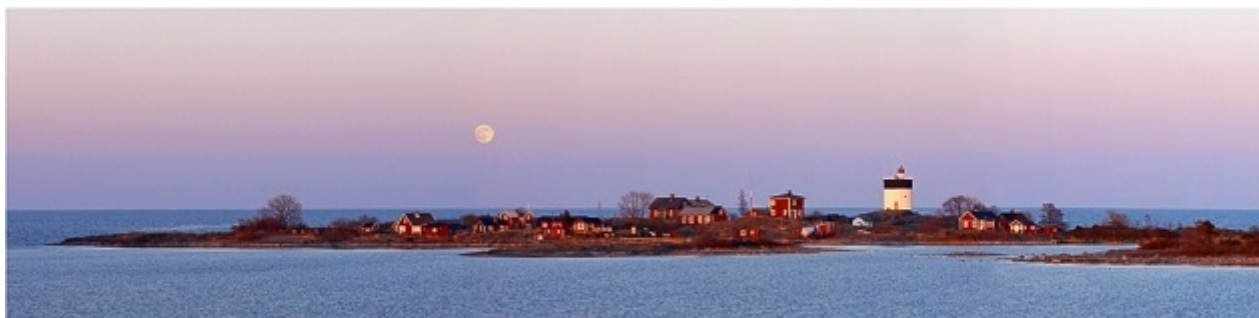
MÅNE VID SVARTKLUBBENS FYRPLATS